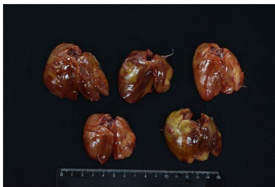
Fig. 1 肝臟腫大，可見多發局部黃白色斑塊。